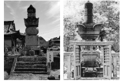
津高虎五輪塔 上野宝篋印塔

寒松院は、天台宗で比叡山延暦寺に属する。慶長年間、藤堂高虎が本堂・庫裏・山門・鐘楼等の建物を建立し、2代高次の従兄弟である清賢大僧都が「昌泉院」(寺領境内1362坪)として開創。高虎が上野寒松院に葬られると、分院となり寺名を「寒松院」と改める。当時の上野寒松院は、現在の上野動物園東園入口一帯で、動物慰霊碑の奥に「藤堂家墓地」が残り、初代高虎から10代高允までの高さ約4.5mの宝篋印塔が並ぶ。津でも藤堂藩歴代藩主の菩提寺となり、津藩初代から10代までの藩主の五輪塔または板石の墓と、夫人や子の墓が並ぶ。北側には、久居藩初代・6・8・9・10・11・13～16代の藩主の墓が並ぶ。(市指定史跡)